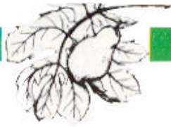
Fruto hermafrodita obtenido mediante polinización controlada.