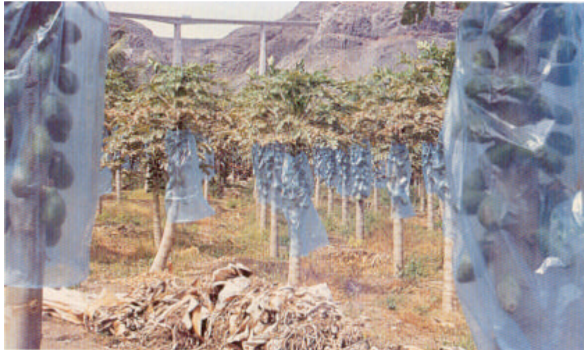
Embolsado de la fruta para protegerla de la maresía y otros daños mecánicos.

Se realiza esta práctica colocando una bolsa de plástico alrededor de los frutos de la planta, de forma semejante a la platanera, cuando las hojas viejas ya se han caído, con el fin de evitar las manchas de latex, producidas al incidir sobre éstos las pequeñas partículas de polvo transportadas por el viento.