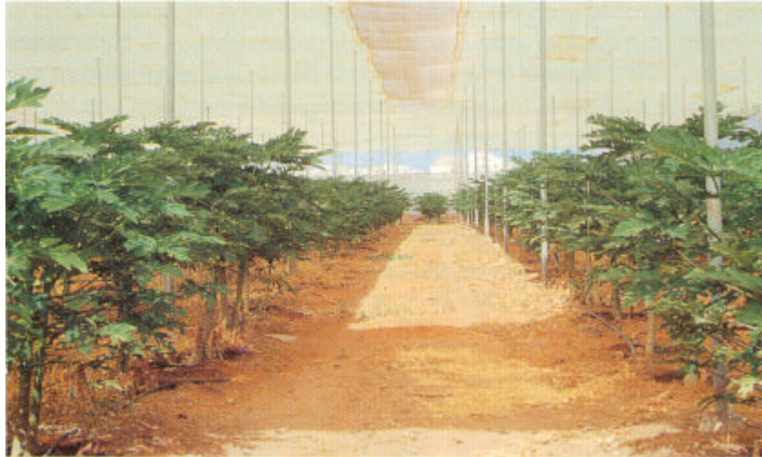
Invernadero de papayas del cultivar Sunrise en la localidad de Las Galletas (zona muy ventosa).

frutos hermafroditas del cultivar "Sunrise" pertenecientes al grupo "Solo" en el que se encuentran los únicos cultivares aptos por el momento para la exportación. Existen diferencias entre cultivares a este respecto, así los menos sensibles a este problema son Sunrise, Higgins y Kapoho, pero por otra parte, estos dos últimos no son los más productivos, lo que conduce a que sólo sea considerado como idóneo dentro del grupo "Solo" para su cultivo en Canarias el cultivar Sunrise.