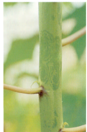
Síntomas producidos por el virus CMV en tallos.