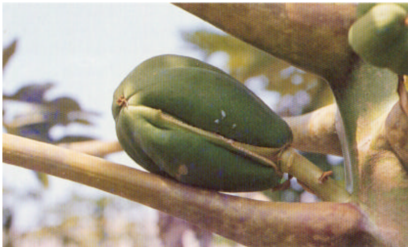
Fruto carpeloide de papaya.

El sexo de las flores de papaya viene determinado genéticamente, aunque luego las condiciones del medio (bajas temperaturas < 20°C, exceso de agua, etc.) produzcan variaciones a nivel de la expresión de los caracteres sexuales que se traducen en fenómenos temporales de cambio de sexo en las flores, muy frecuente en Canarias.