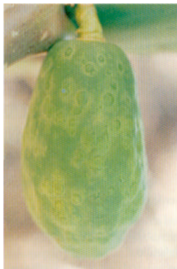
Síntomas producidos por el Virus PRSV en frutos