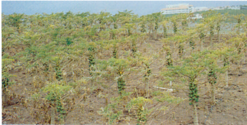
Plantación de papaya del cultivar Sunrise afectada por el virus PRSV.

Estudios recientes han demostrado la presencia de virosis en la isla de Tenerife, tanto en el Norte y Sur de la isla, como en condiciones invernadero y aire libre. Asimismo es muy probable que existan en otras islas, lo que sugiere en principio que hay que tomar mayores precauciones en el momento de hacer nuevas plantaciones.