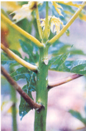
Síntomas producidos por el Virus PRSV en tallos.