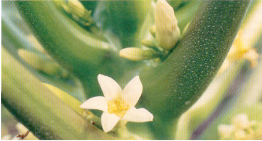
Flor hermafrodita de papaya.