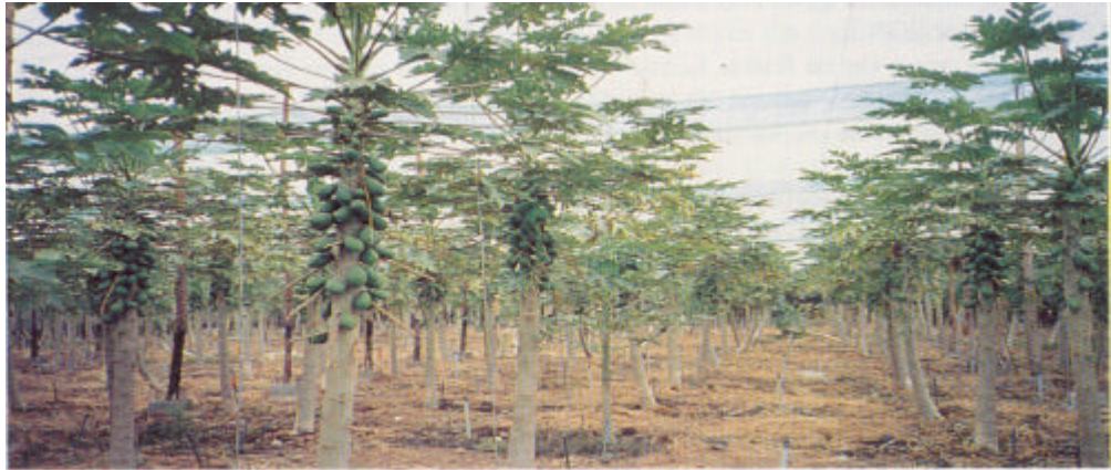
Cultivo de papayas del cultivar Sunrise en la localidad de Valle de Guerra( zona norte).