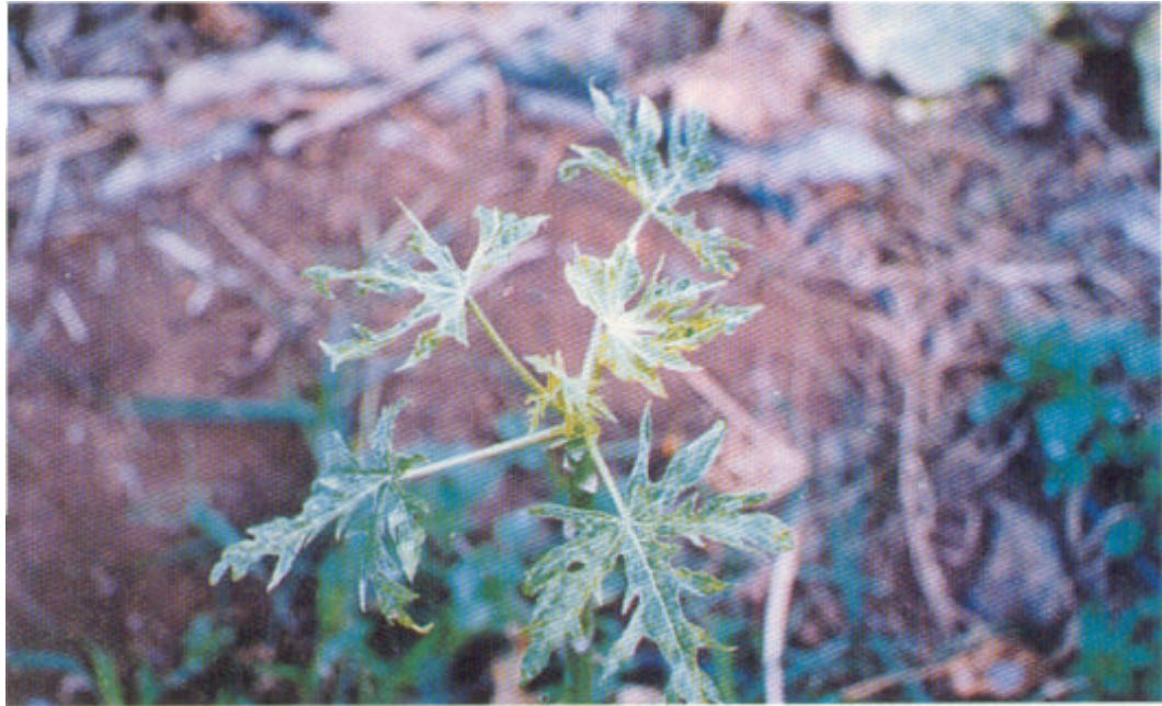
Síntomas producidos por el virus PRSV en hojas.

c) en los frutos se observan manchas grasientas y amarillas en fon-na anillo.