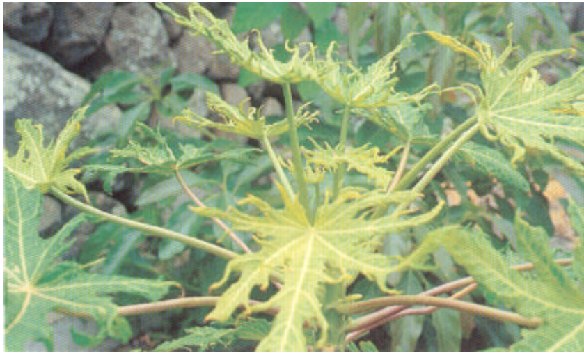
Síntomas de ataques de ácaros en hojas jóvenes u adultas de papaya.

Control: Lannate (m.a. metomilo). Dosis 2 cc/l.