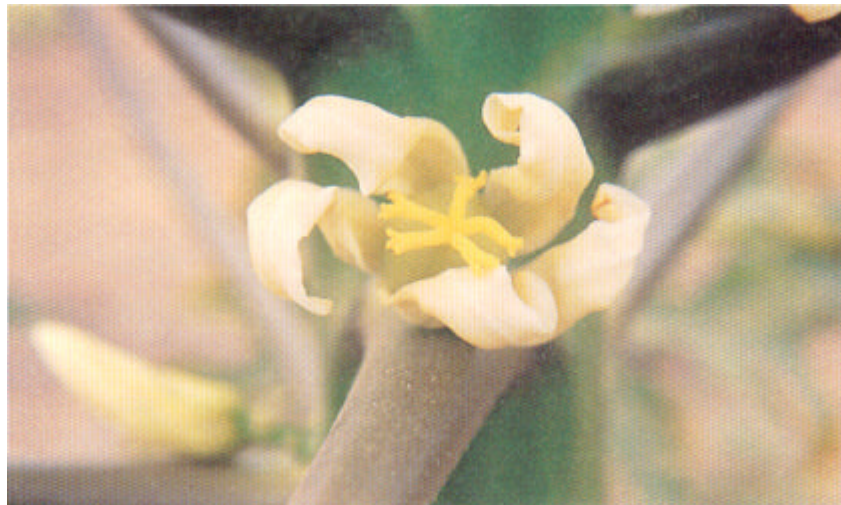
Flor femenina de papaya.

A efectos prácticos es conveniente saber lo que sucede en los distintos cruces posibles entre los tres sexos: