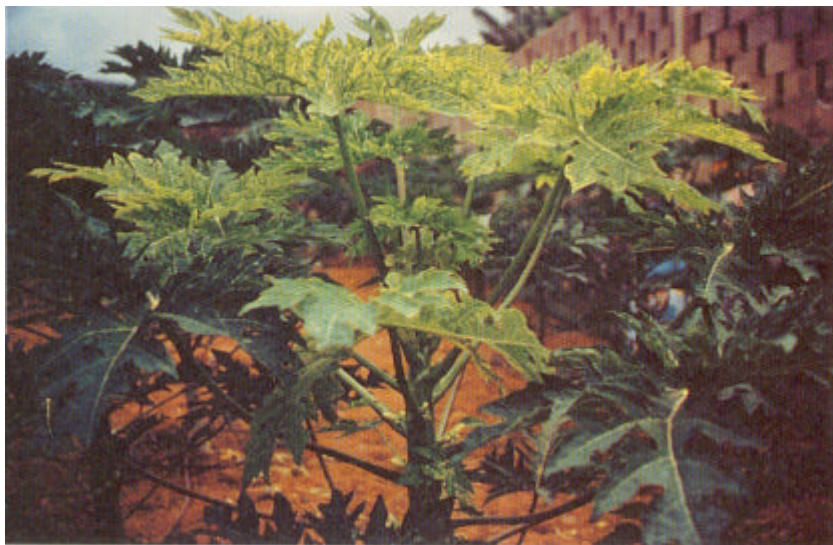
Síntomas producidos por el virus CMV en hojas.

El virus del mosaico del pepino (CMV) no había sido hasta ahora citado como patógeno de la papaya. Su sintomatología se manifiesta en el tallo con manchas grasas a modo de nudo de la madera y en las hojas apicales un mosaico generalizado.